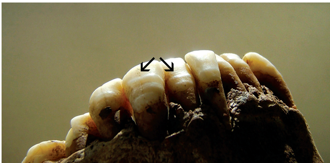
Рисунок 1. Эмалевая гипоплазия на клыке и внешнем резце нижней челюсти. Серия эскимосы Эквен. Мужчина. КО № 376/244

Figure 1. Enamel hypoplasia on the canine and external incisor of the lower jaw. A series of Eskimo (Inuits) Ekven. Male. KO #376/244